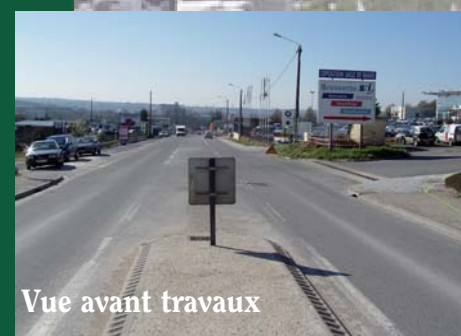
Vue avant travaux