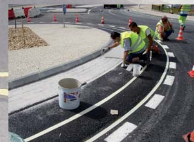
Pose de pavés sur résine