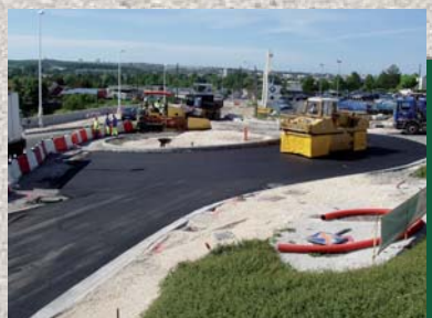
Mise en oeuvre des enrobés (1/2 giratoire)