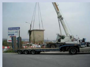
Dépose poste de transformation