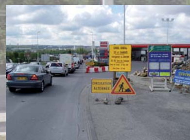
Travaux sous circulation avec alternats