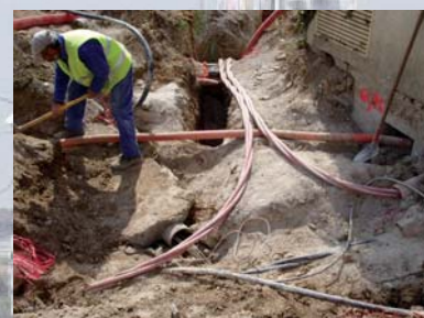
Travaux de réseaux