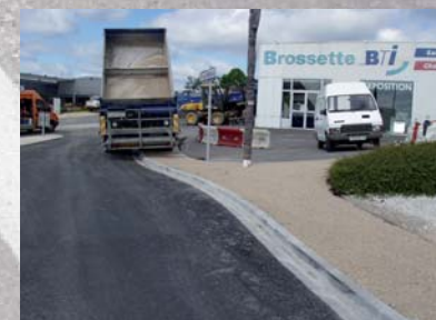
Enduits sur trottoirs