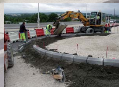
Pose de bordures préfabriquées