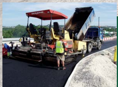
Mise en oeuvre des enrobés