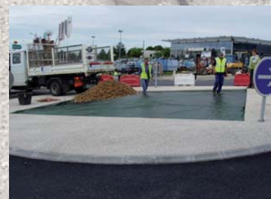
Film polypropylène et galets avant plantations