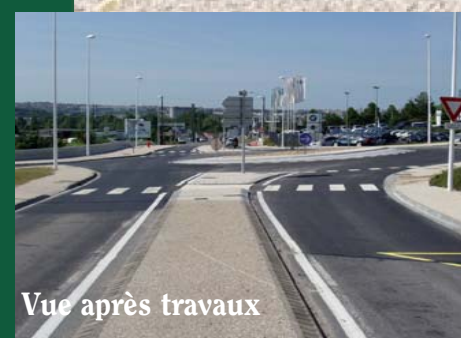
Vue après travaux