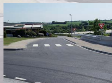
Branche vers Intermarché/Restaumarché