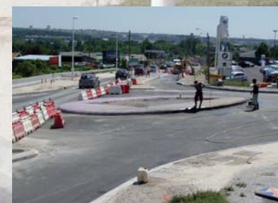
Béton désactivé au centre du giratoire