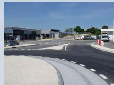
Branche vers la zone des Avenauds