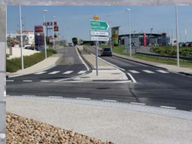
Branche vers Poitiers