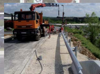
Pose de glissières de sécurité