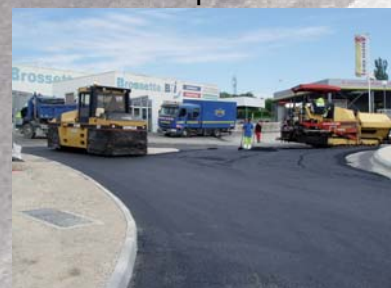
Mise en oeuvre des enrobés

Les travaux sous maîtrise d'ouvrage départementale auront duré 3 mois . Ils ont été réalisés sous circulation avec alternat par feux de chantier.