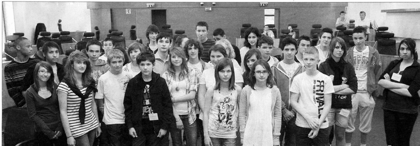
Les élus du Conseil général des jeunes ont fait le point sur leurs travaux.

CONSEIL GÉNÉRAL DES JEUNES Les quarante-six collégiens élus au Conseil général des jeunes terminent leur mandat de deux ans sur des réalisations intéressantes