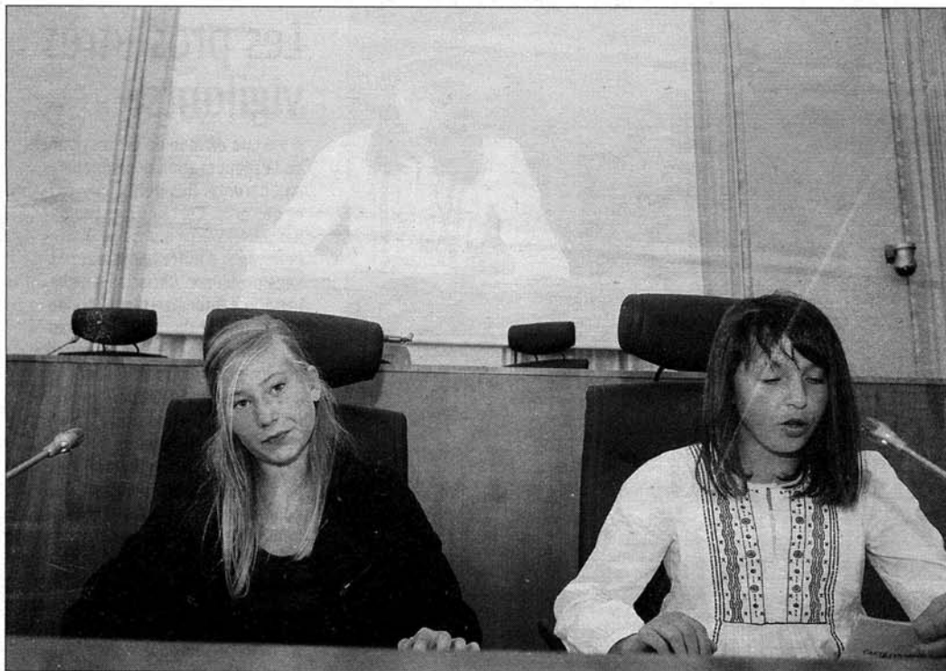
Dernière session. Les jeunes conseillers généraux ont pris leur mandat très au sérieux.

■ Dernière session pour le conseil général des jeunes ■ À l'heure du bilan, les jeunes élus n'ont pas à rougir de leurs actions.