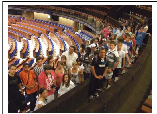
Visite de l'hémicycle du Conseil de l'Europe