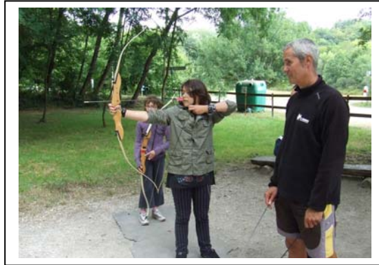
Tir à l'arc