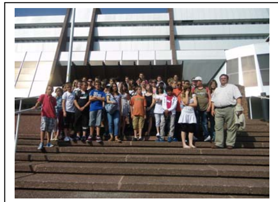
Arrivée au Conseil de l'Europe