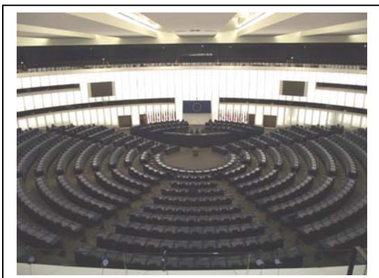
Visite de l'hémicycle du Parlement Européen